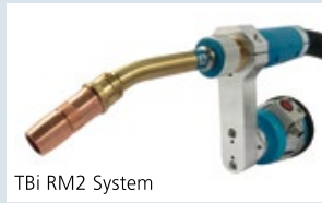
TBi RM2 System