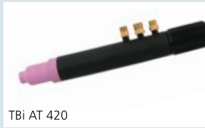
TBi AT 420