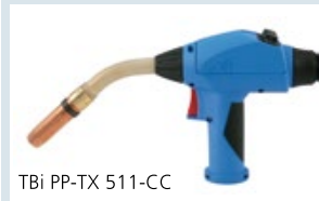
TBi PP-TX 511-CC