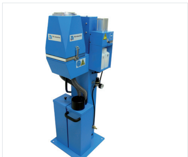
TBi JetStream mit FineSpray-2