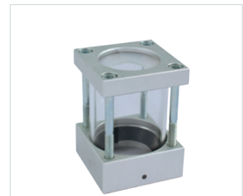
Zubehör: Transparente Sprühkammer Art. Nummer 531P101800